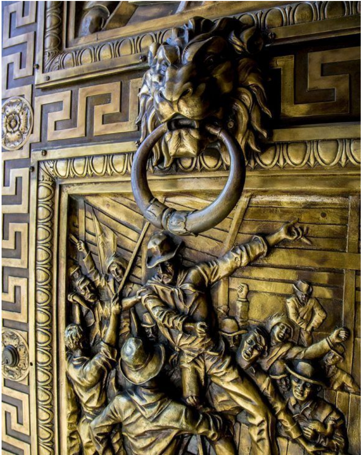
Detalle de las puertas del Capitolio Nacional, La Habana, 2018.