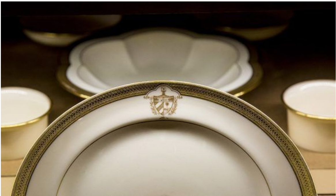
Detalle de la vajilla del Capitolio Nacional, La Habana, 2018.