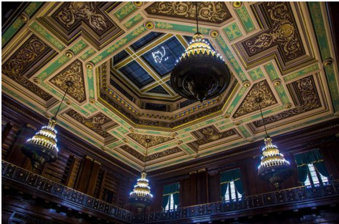
Biblioteca del Capitolio Nacional.

https://www.radiohc.cu/de-interes/caleidoscopio/180858-historias-del-capitolio-fotos