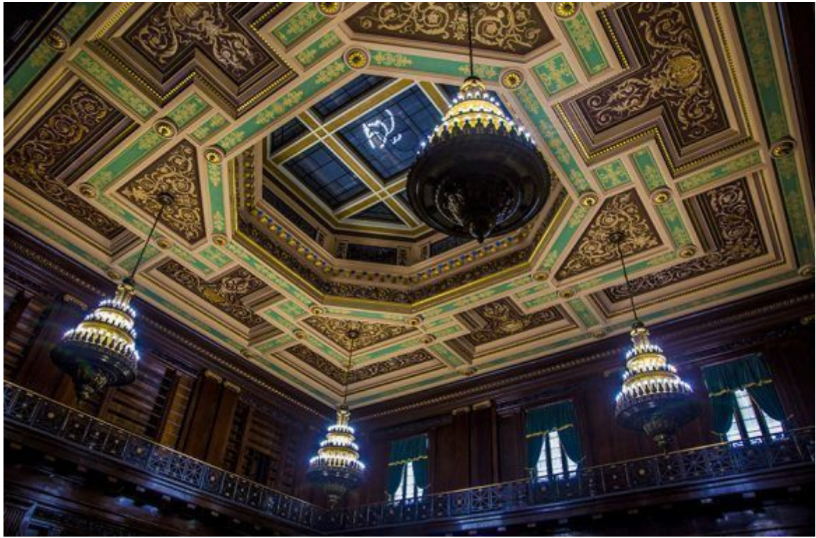
Biblioteca del Capitolio Nacional.

https://www.radiohc.cu/de-interes/caleidoscopio/180858-historias-del-capitolio-fotos