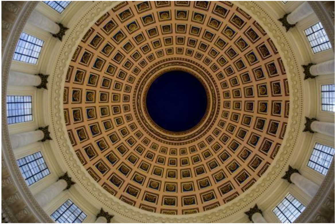
Capitolio Nacional, La Habana, 2018.