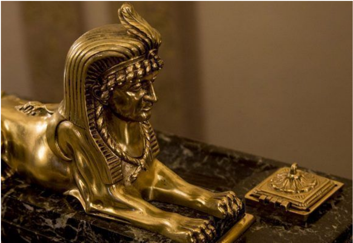
Capitolio Nacional, La Habana, 2018.