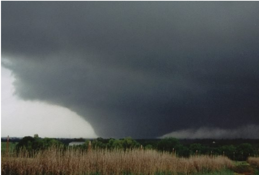
El tornado del 3 de mayo de 1999.