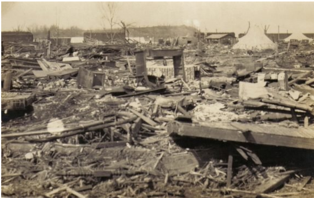
Destrozos provocados por el tornado en Griffin, Indiana.

mueritos, así como 2 027 lesionados, y destruyó unas 15 000 viviendas.