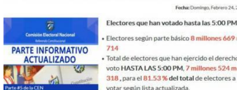
Electores que han ejercido el voto hasta las 5:00 pm