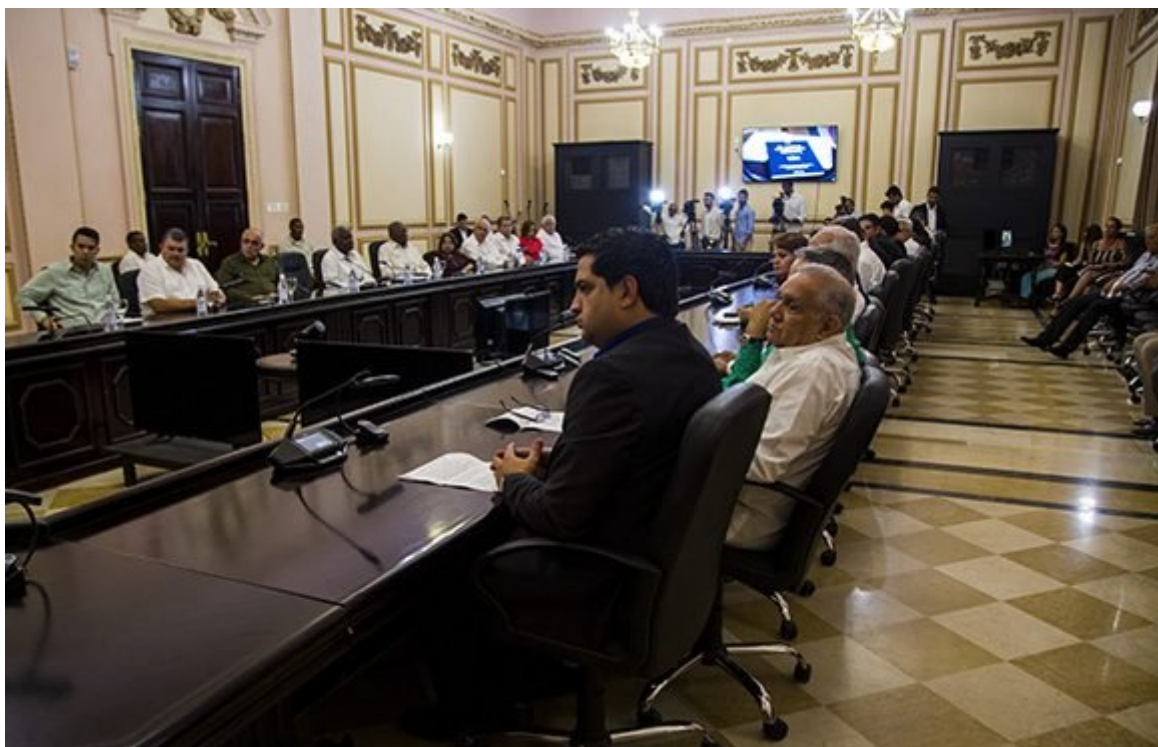
Presentación de El Libro de las Constituciones.