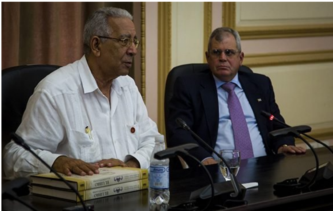
El doctor Eduardo Torres Cuevas y Homero Acosta, secretario del Consejo de Estado.

Estuvieron presentes en la actividad el Presidente de la Asamblea Nacional, Esteban Lazo, el primer vicepresidente Salvador Valdés Mesa; así como integrantes de la Comisión Redactora de la Constitución.