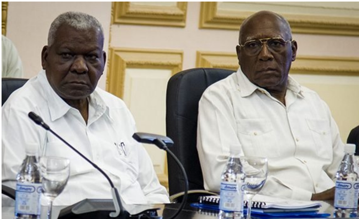
Esteban Lazo Hernández, Presidente de la Asamblea Nacional y Salvador Valdés Mesa, primer vicepresidente de los Consejos de Estado y de Ministros.