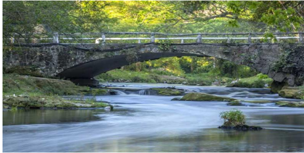
Viejo puente del Almendares

Ocultas entre la vegetación exuberante de la zona, se observan las ruinas de la Mansión Josefina. Arcos que representan la opulencia, escaleras de varios peldaños y una vista impresionante debieron hacer de esta construcción una de las más destacadas de su época.