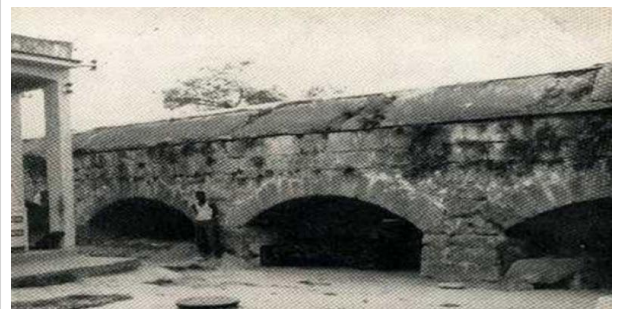
Acueducto de Fernando VII

encuentran, varios de sus remanentes más importantes pertenecientes al sistema de la Zanja y más cercanos a la represa superviven: el canal de salida, el muro rematado por una obra de concreto donde estaban las compuertas de hierro que ahora están desarticuladas y amenazadas de desaparecer por la oxidación.