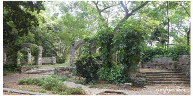
Ruinas de la mansión de Josefina

con su calle adoquinada y muy cerca el Mirador, que es la zona más elevada del trayecto de la avenida del Parque Almendares.