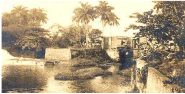
Antigua presa El Husillo

Este enigmático sitio capitalino, lleno de hermosos rincones y parajes por descubrir atesora restos arqueológicos de la antigua presa El Husillo, los canales del Acueducto de Fernando VII y las Ruinas de la Mansión Josefina.