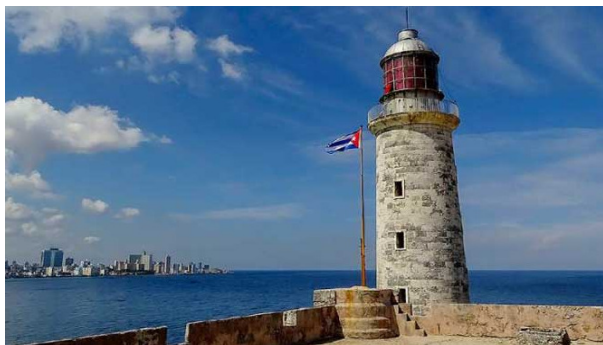
Faro Castillo del Morro

Proporcionan también seguridad, sobre todo para la navegación nocturna y verifican la posición correcta en la carta de navegación.