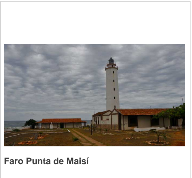
Faro Punta de Maisí

Este gigante no solo guía a las embarcaciones sino también a los aviones que transitan por la región.