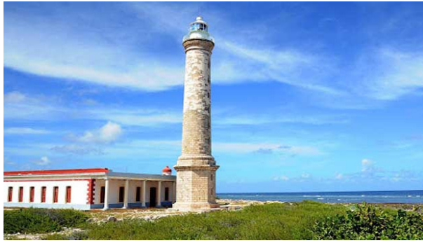
Faro Punta Lucrecia