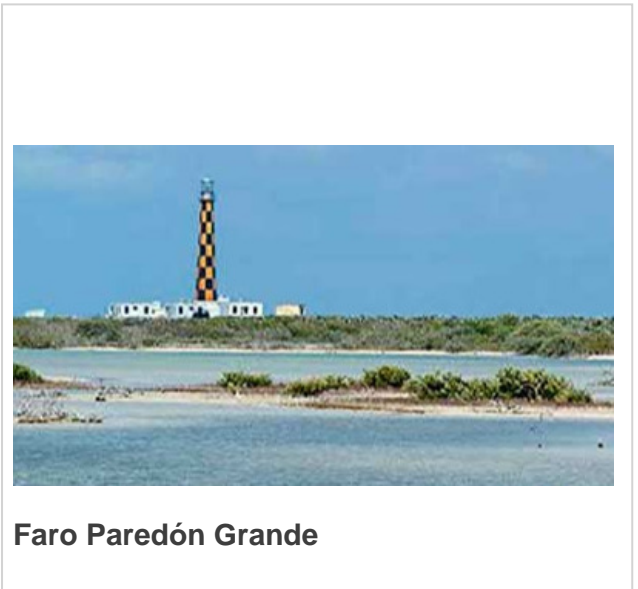
Faro Paredón Grande

Está rodeado por una de las más bellas playas vírgenes de Cayo Paredón Grande y resulta un lugar paradisíaco para observar la naturaleza. Para llegar a él se debe recorrer por un pedraplén de 33 kilómetros realizado sobre el mar.