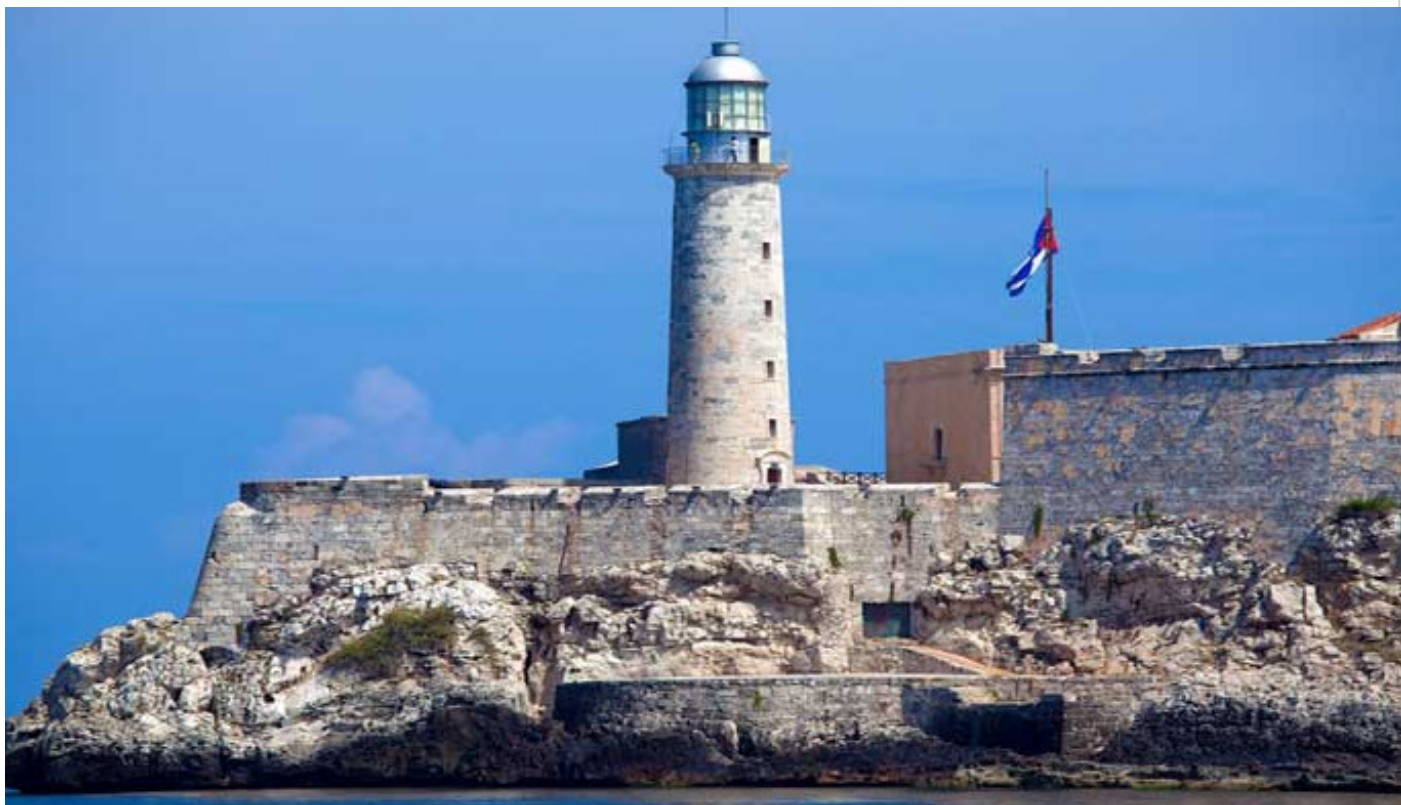
Faros de Cuba