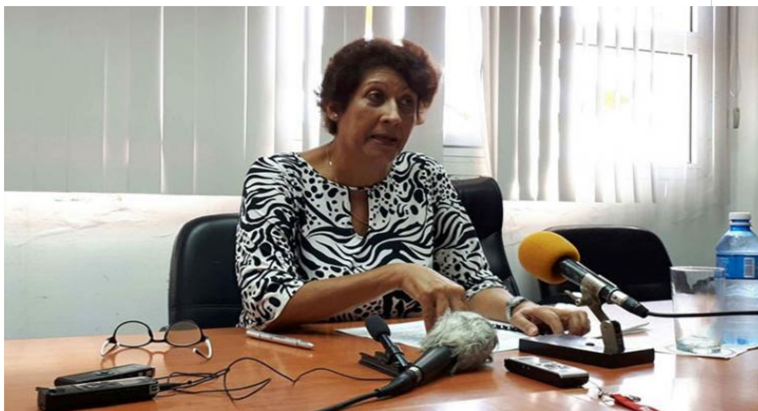
La titular llamó a extremar la higiene en todos los centros educacionales.

La Habana, 29ago (RHC) La ministra de Educación de Cuba, Ena Elsa Velázquez, aseguró que están creadas las condiciones para reiniciar el curso escolar 2019-2020 en gran parte del país, con excepción de La Habana y algunos municipios de otras provincias a causa de la COVID-19.