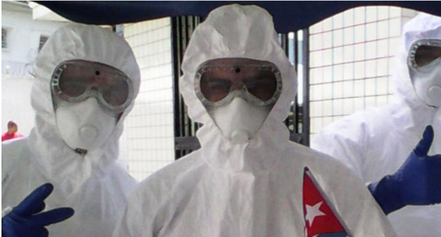
Médicos cubanos en franca lucha por salvar vidas.

Citó declaraciones del autor de más de mil canciones, himnos, óperas y muchas otras piezas musicales de gran reconocimiento, cuando dijo que 'La Revolución cubana es un ejemplo luminoso para los pueblos del mundo, que señala el camino de la lucha por la independencia y su liberación de las garras del imperialismo'.