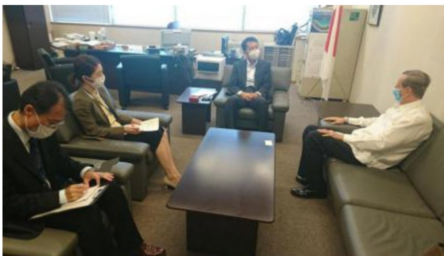
Cuba y Japón mantienen relaciones diplomáticas hace 90 años.

La Habana, 2 sep (RHC) El nuevo Director General del Buró de América Latina y Caribe de la Cancillería de Japón, Hayashi Teiji, manifestó a Miguel Ángel Ramírez, embajador de Cuba en ese país, el interés de su gobierno de continuar fortaleciendo las relaciones bilaterales con la mayor isla de las Antillas.