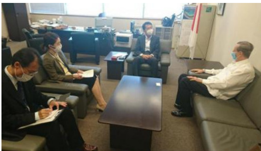
Cuba y Japón mantienen relaciones diplomáticas hace 90 años.

La Habana, 2 sep (RHC) El nuevo Director General del Buró de América Latina y Caribe de la Cancillería de Japón, Hayashi Teiji, manifestó a Miguel Ángel Ramírez, embajador de Cuba en ese país, el interés de su gobierno de continuar fortaleciendo las relaciones bilaterales con la mayor isla de las Antillas.