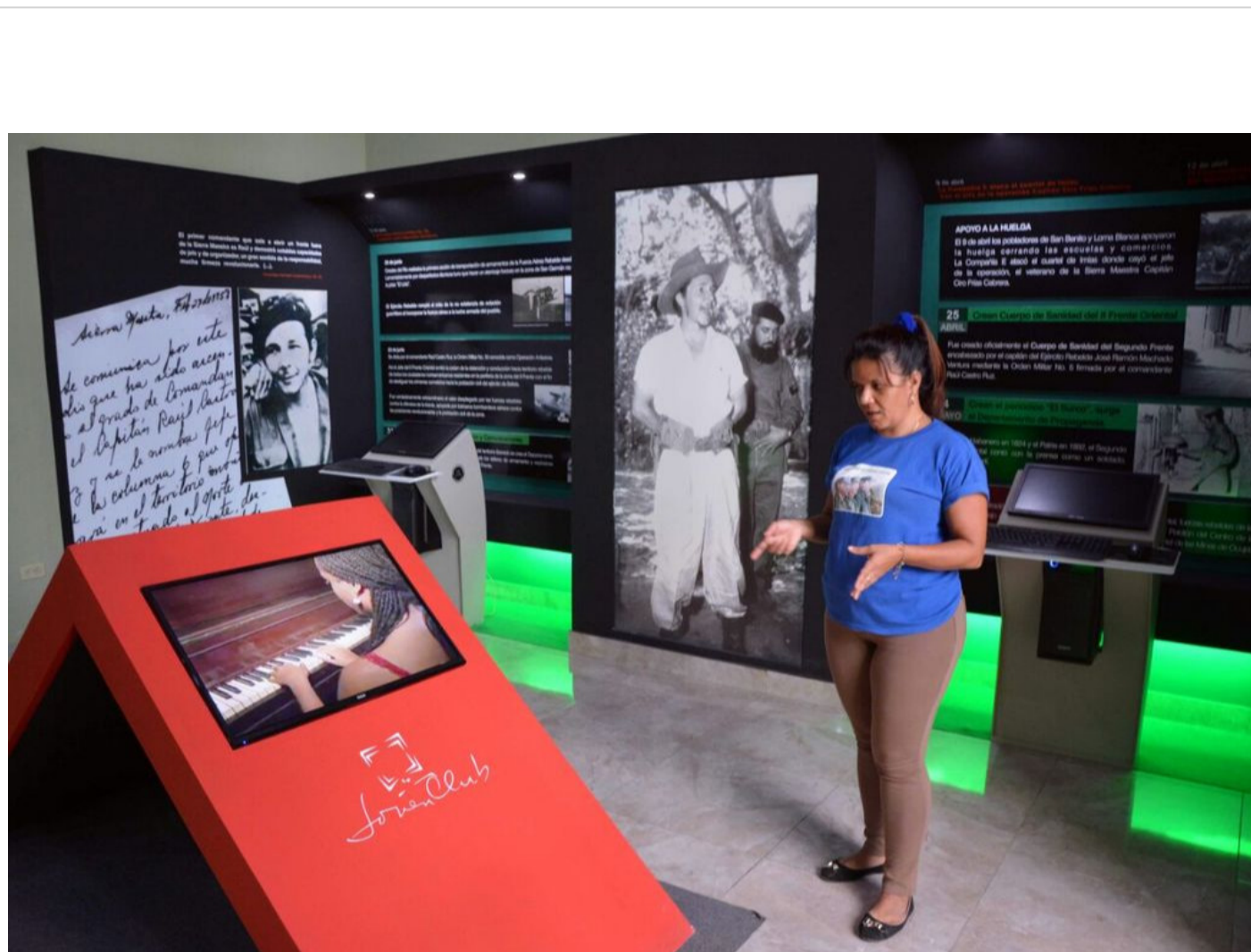
Palacio Provincial de Computación, de Santiago de Cuba.