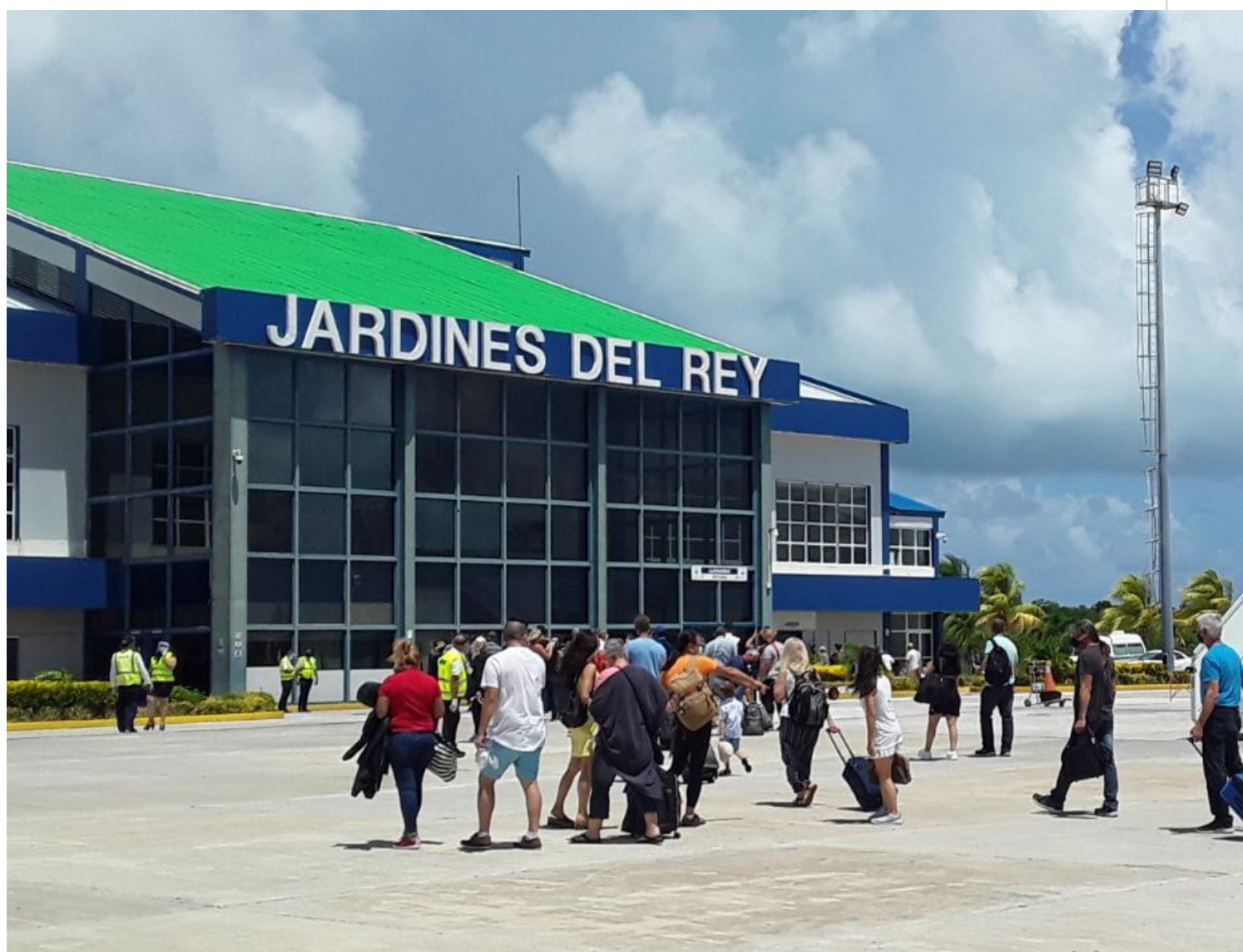
Arribo de turistas canadienses al destino Jardines del Rey, etapa pos covid.