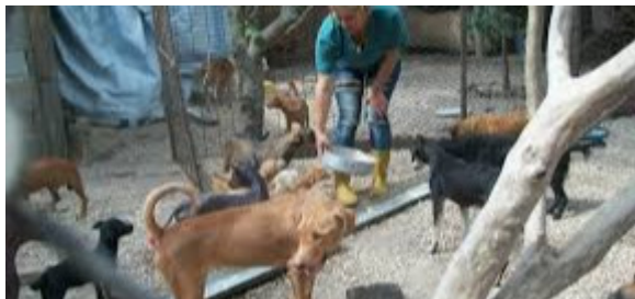
normas jurídicas con vistas al bienestar animal en Cuba

En declaraciones al periódico Jueventud Rebelde, añadió que en sus acápites la norma tendrá un enfoque cultural y educativo, porque lo que se persigue es fomentar desde las edades tempranas una vocación animalista, la cultura del respeto a los animales, de la protección y de la relación hombre, animal y medio ambiente.