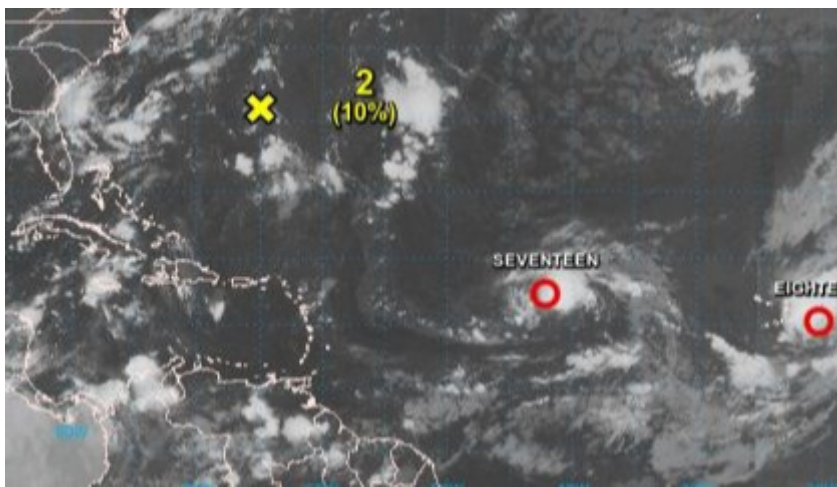
Imagen del satélite.

La Habana, 7 sep (RHC) El área de bajas presiones que se localizaba sobre aguas del Atlántico central, en la noche de ayer continuó ganando en organización para convertirse en la depresión tropical número diecisiete de la actual temporada ciclónica.