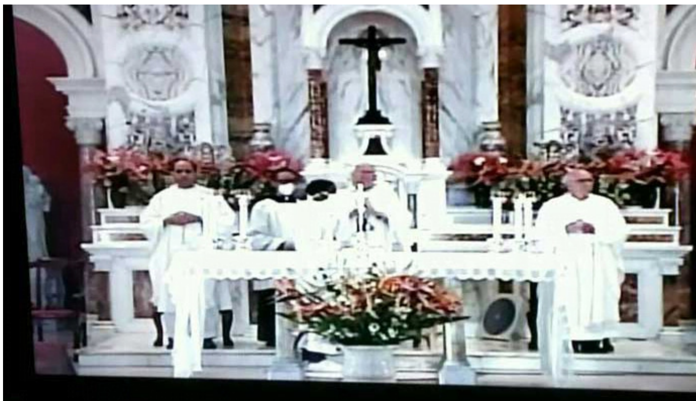
Trasmitió TV cubana misa en honor a la Virgen de la Caridad del Cobre

Santiago de Cuba, Sep 8 (PL).- La televisión cubana transmitió la eucaristía solemne en honor de la Virgen de la Caridad, patrona de Cuba, que se celebró en la mañana de este martes desde su santuario en El Cobre, localidad próxima a la ciudad de Santiago de Cuba.