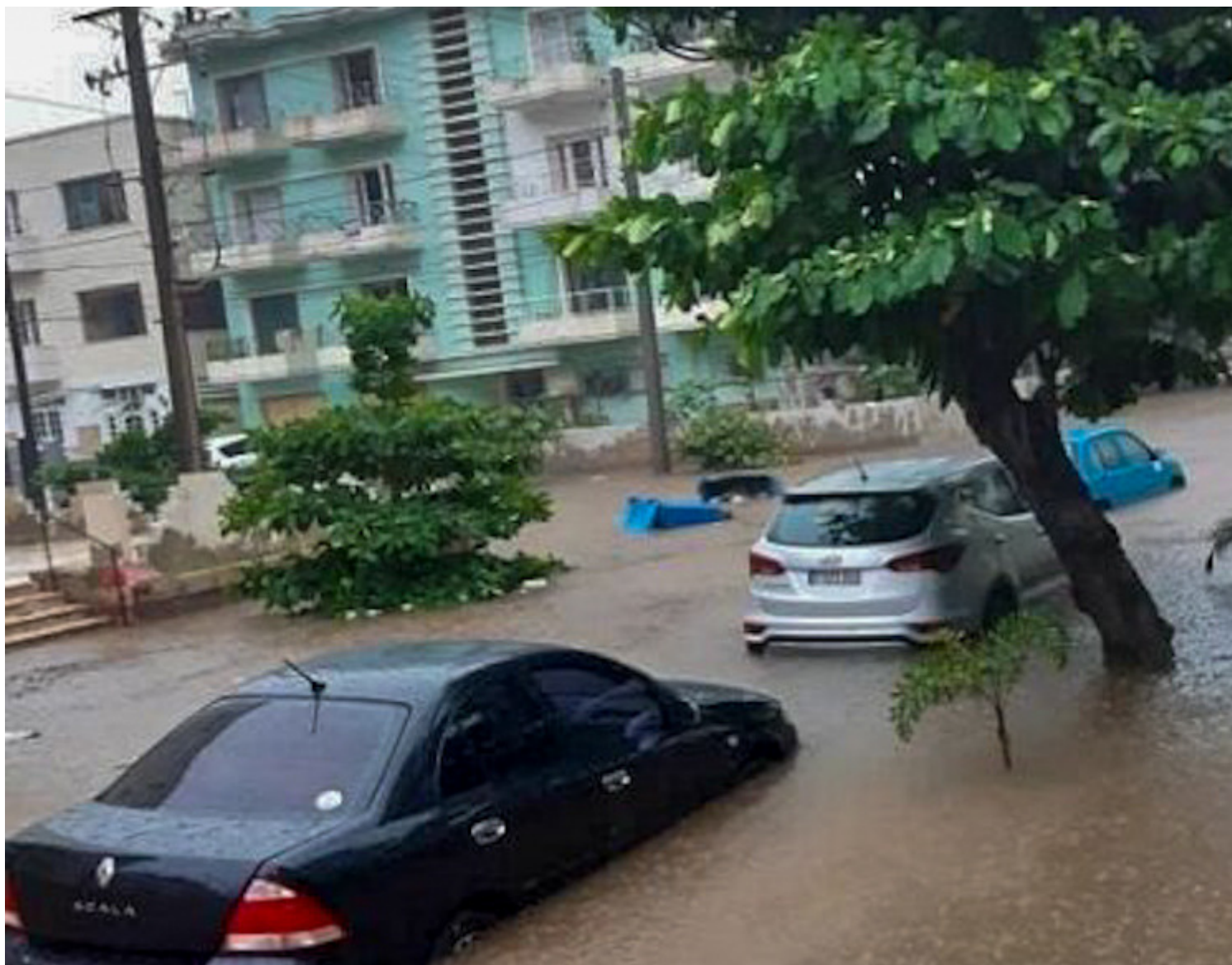
Tormena eléctrica afecta a La Habana

La Habana, 9 sep (Redacción Web).- Una severa tormenta castigó a La Habana en la tarde de este miércoles y sus intensas lluvias inundaron calles y avenidas de varios municipios, lo cual provocó algunos daños en inmuebles, aún sin cuantificar.