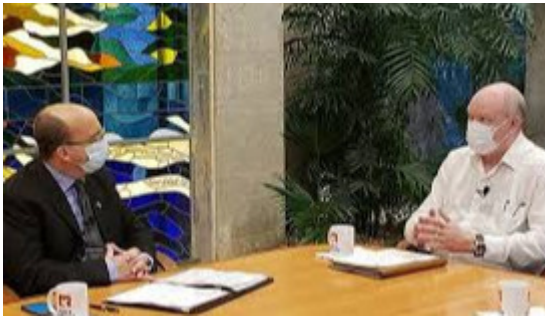
Ministro Malmierca: Cuba incentiva exportaciones para desarrollar su economía

La Habana, 9 sep (PL).- Cuba incentiva las exportaciones de diversos actores de la economía, incluido el sector privado, destacó hoy el ministro de Comercio Exterior e Inversión Extranjera, Rodrigo Malmierca.