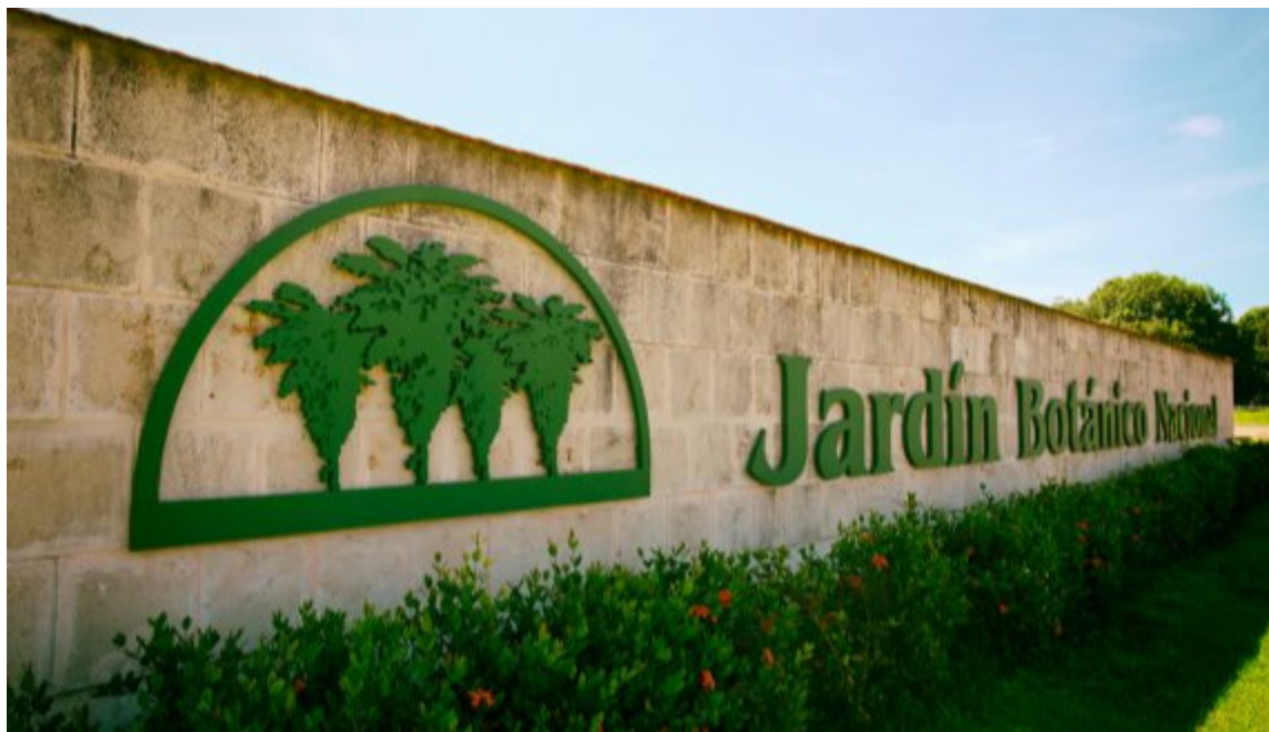
Jardín Botánico Nacional.

La Habana, 20 sep (RHC) El Jardín Botánico Nacional está cerrado al público en estos tiempos de restricciones, después de haber roto su récord de visitas para un día tras su reapertura en el verano.