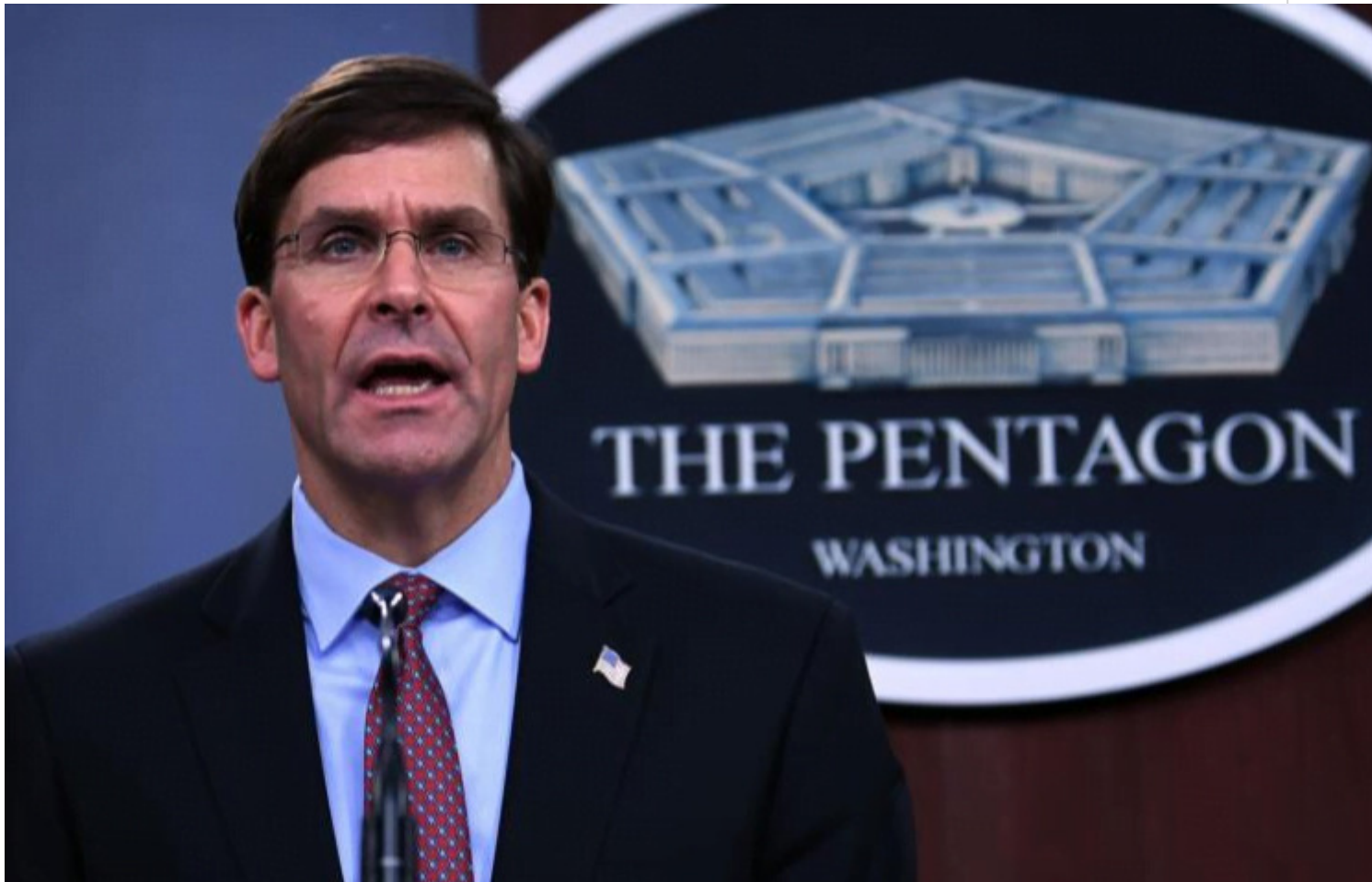
Mark Esper, secretario de Defensa de EE.UU.

De acuerdo con Washington Post, unos 183 millones de dólares se adjudicaron al fabricante de motores de aviación Rolls Royce y a ArcelorMittal, indispensable para mantener la industria naval militar y sus astilleros.