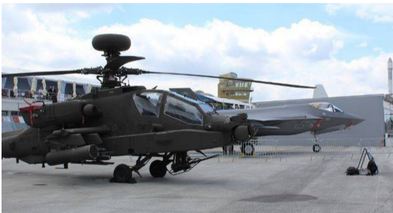
Unos 183 millones de dólares se destinaron a la aviación.

La Habana, 23 sep (RHC) El rotativo The Washington Post reveló que el Pentágono desvió una buena parte de los 1 000 millones de dólares de los fondos asignados para combatir la Covid-19 en EE.UU. y los redirigió a la fabricación de equipos militares en el Ejército.