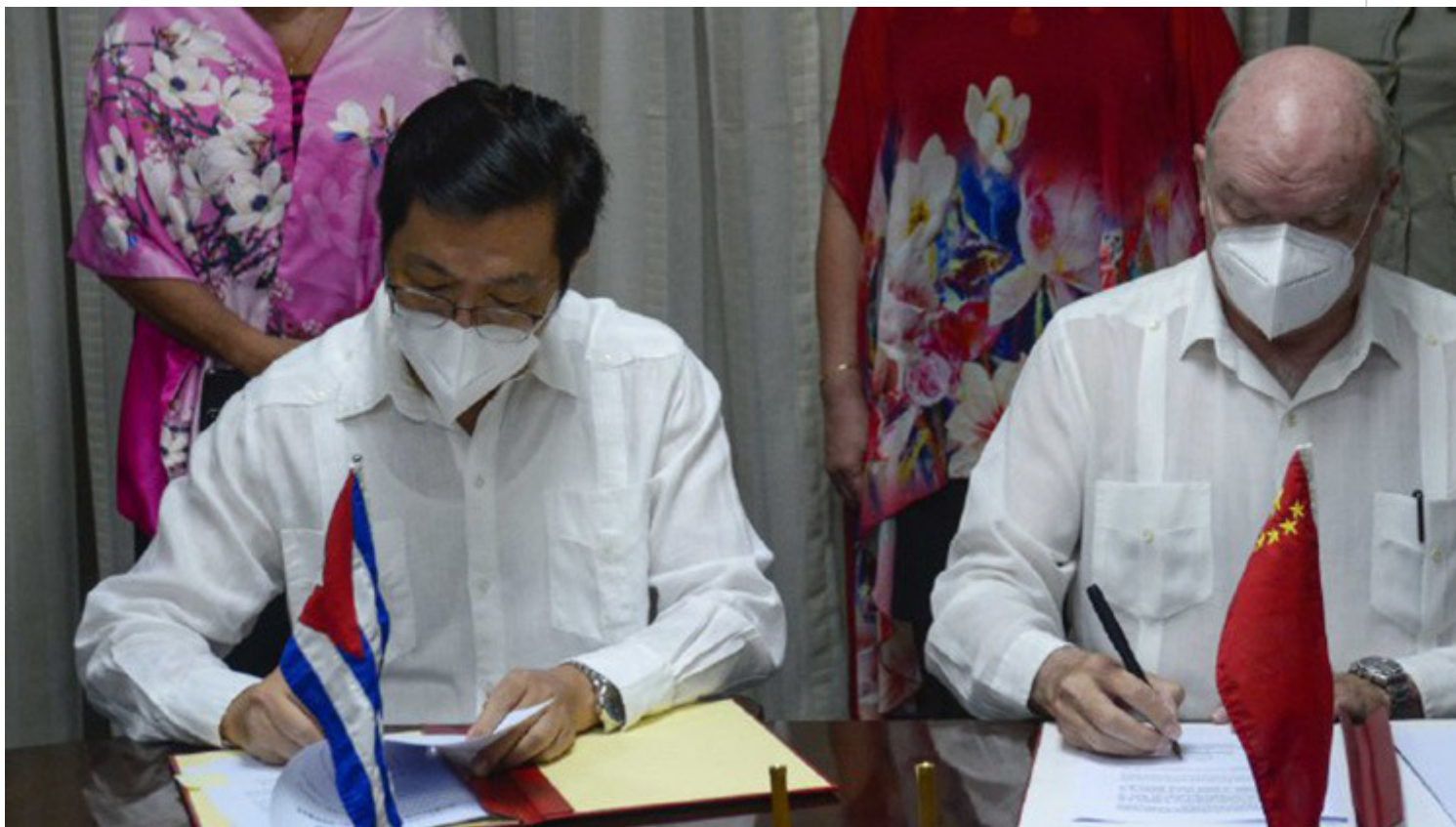
Chen Xi y Rodrigo Malmierca en La Habana.

La Habana, 28 sep (RHC) Los gobiernos de China y Cuba fortalecen la cooperación en áreas como la salud, la industria y la informatización, al firmar este 28 de septiembre en La Habana, varios instrumentos jurídicos, justo el día en que se conmemora el aniversario 60 del restablecimiento de relaciones entre los dos países.