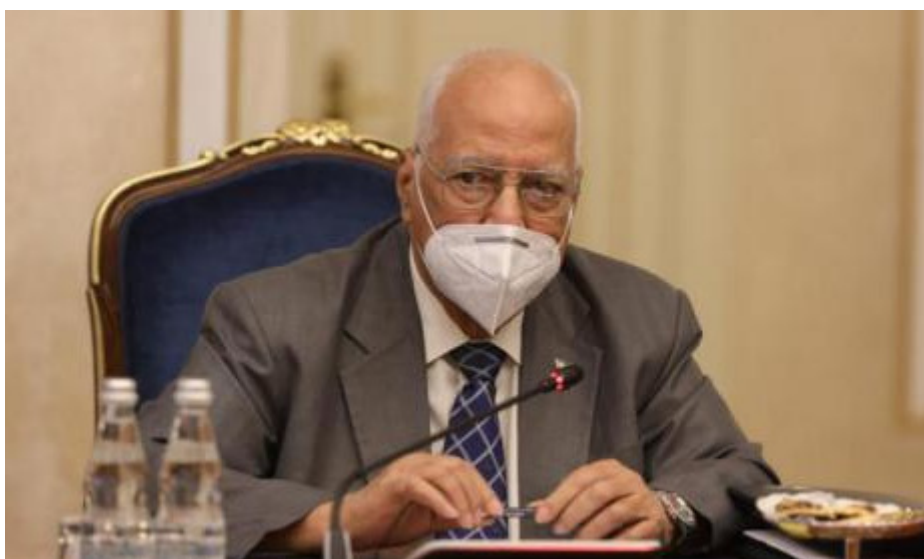
Cabrisas analizó temas relacionados con el sector ferroviario, automotor y marítimo.

La Habana, 1 Oct (RHC) El viceprimer ministro cubano, Ricardo Cabrisas Ruiz, concluyó su visita a la Federación de Rusia, donde desarrolló un intenso programa de trabajo que incluyó más de una treintena de reuniones con altas autoridades políticas del gobierno, del Parlamento, ministros, jefes de entidades y directivos de empresas.