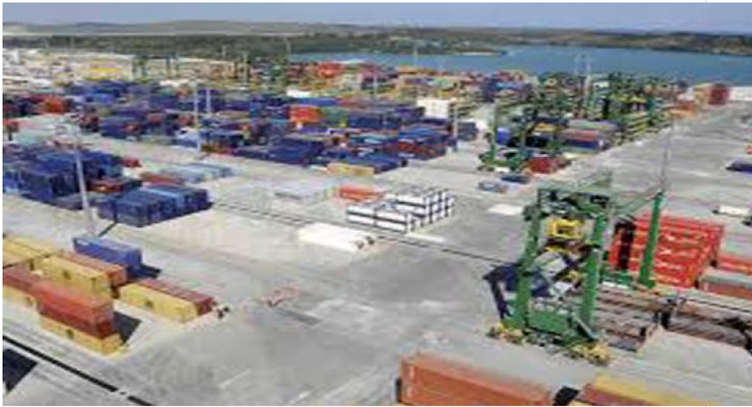
Zona Especial de Desarrollo Mariel, excelente para hacer negocios.

La Habana, 1 oct (RHC) El Ministerio de Economía y Planificación de Cuba (MEP) divulgó nuevas medidas para fortalecer la empresa estatal socialista en el país.