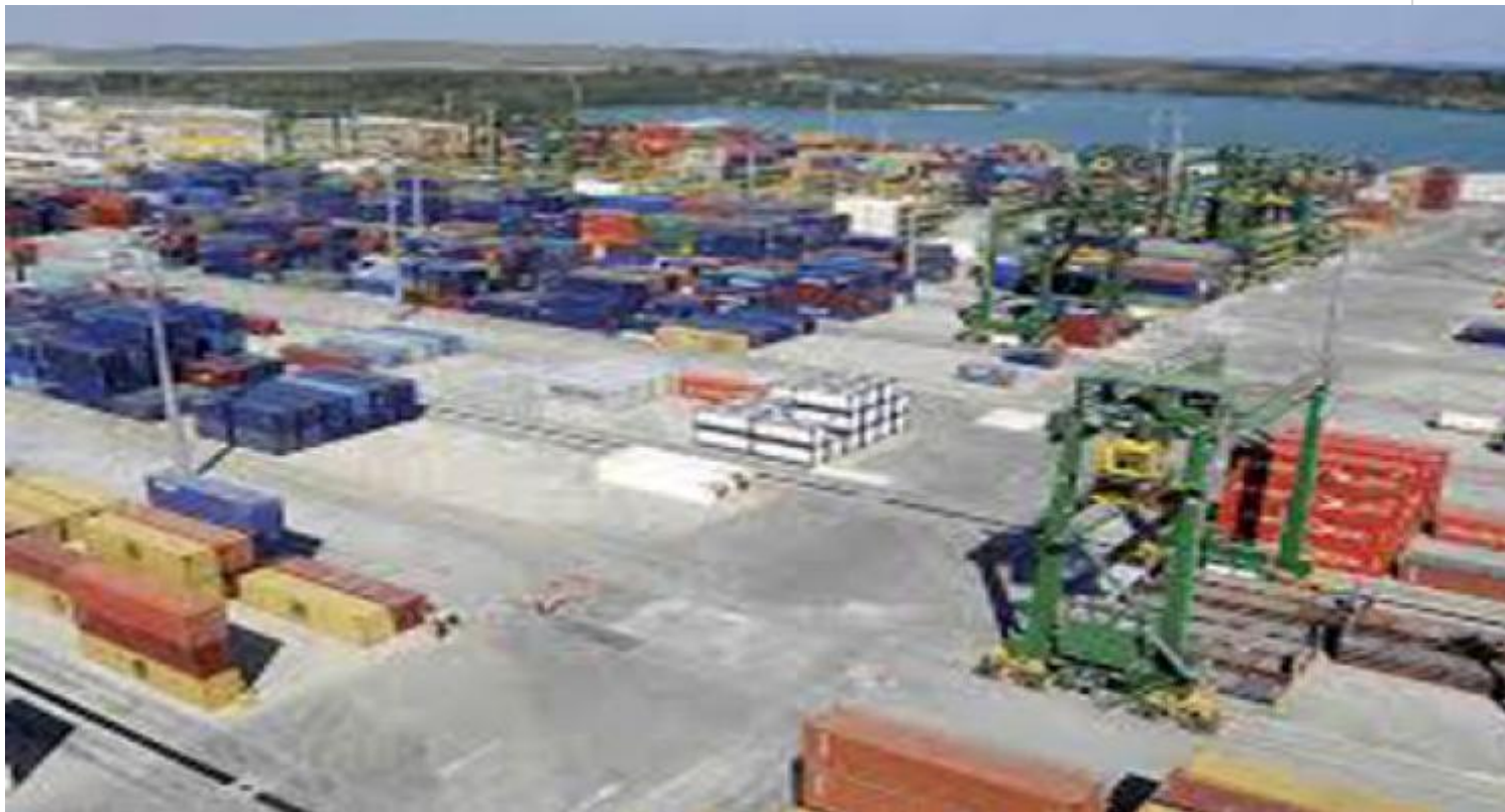
Zona Especial de Desarrollo Mariel, excelente para hacer negocios.

La Habana, 1 oct (RHC) El Ministerio de Economía y Planificación de Cuba (MEP) divulgó nuevas medidas para fortalecer la empresa estatal socialista en el país.