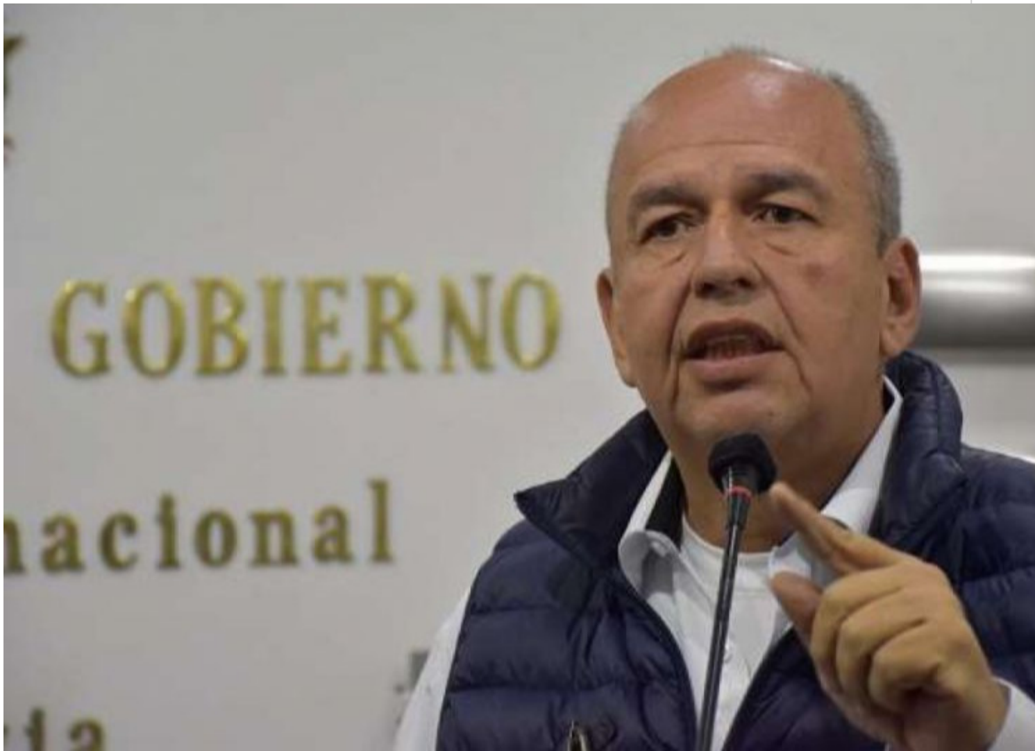
Murillo ataca enconadamente al Movimiento al Socialismo.