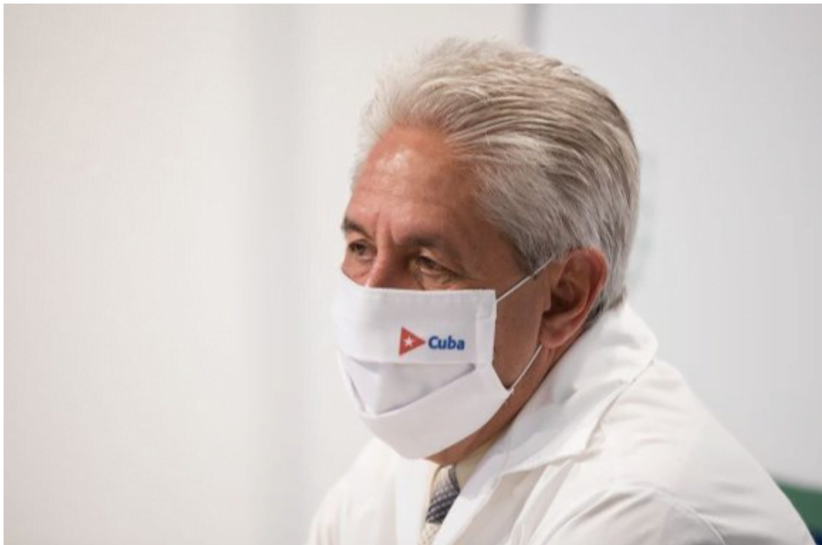
Durán insiste en la necesidad de ser responsables ante la pandemia.

Dijo que en hospitales permanecen ingresados confirmados, 488 aquejados con la Covid-19, de ellos, 487 tienen una evolución clínica estable.