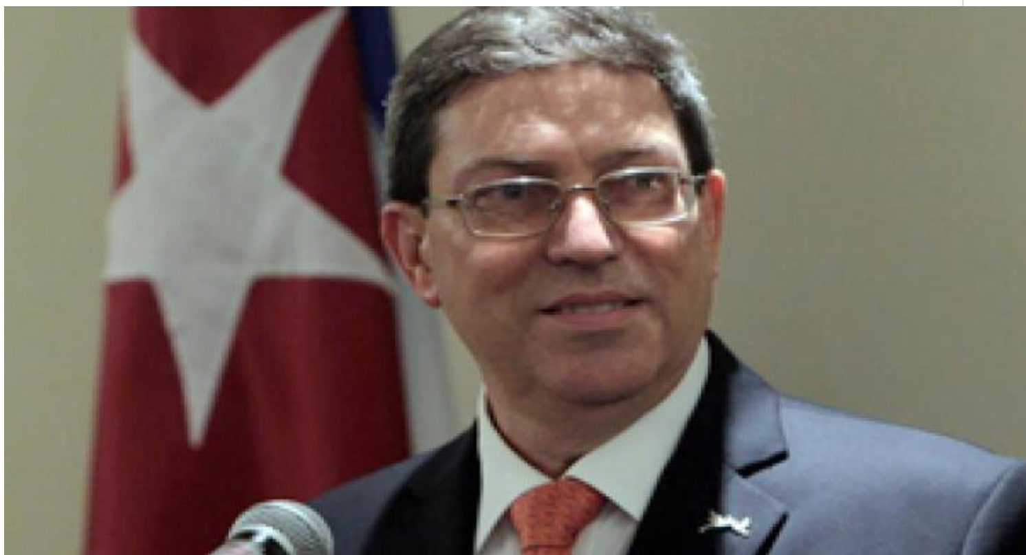
Rodríguez dialogó con su homólogo somalí.

La Habana, 5 oct (Red Web) El titular del Ministerio de Relaciones Exteriores de Cuba, Bruno Rodríguez informó este lunes, en su cuenta en Twitter, acerca de los esfuerzos que continúa realizando nuestro Gobierno a favor del retorno de los dos médicos secuestrados hace más de un año en Kenia.