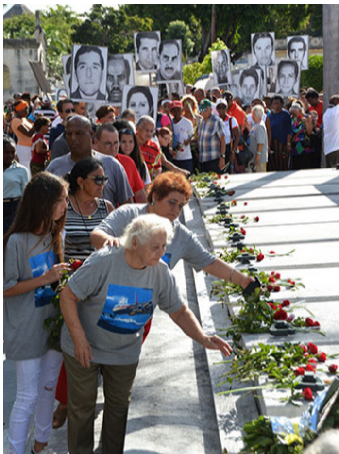
Tributo permanente a las víctimas del horrendo crimen.