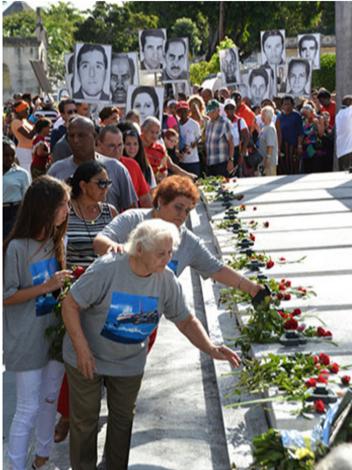
Tributo permanente a las víctimas del horrendo crimen.