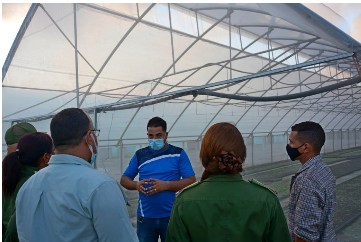
Isla de la Juventud se prepara ante la proximidad del huracán Delta.

Nueva Gerona, 6 oct (RHC) El Consejo de Defensa Municipal (CDM) del municipio especial de la Isla de la Juventud -en composición reducida- comprobó in situ la preparación frente a la inminencia del paso del huracán Delta por el suroccidente de Cuba.