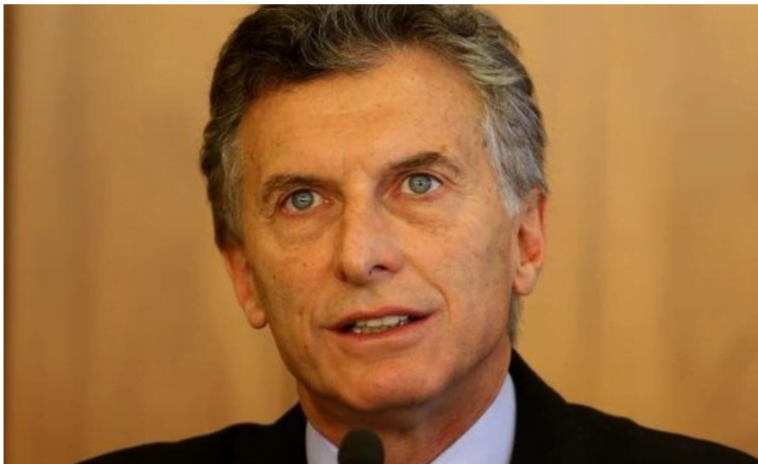
Mauricio Macri.

Por su parte, Argentina, bajo el mandato del hoy ex presidente Mauricio Macri, vivió una experiencia similar hasta 2019, cuando aún tenía fresca en la memoria la debacle del 2001, que provocó incluso, la renuncia a la jefatura de Estado de Fernando de la Rúa.