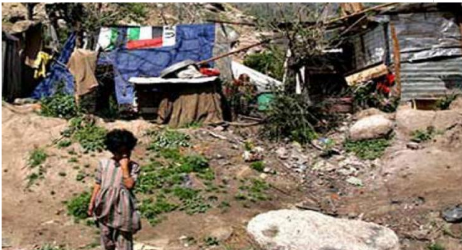
La miseria, un flagelo del que no escapan los más vulnerables.

Peor aún, la pobreza extrema, o sea la miseria, esa condición en la que personas y hogares son incapaces de cubrir los apremios básicos de alimentación, vestido, salud, vivienda o educación, alcanzará a 95 millones de habitantes, la misma cifra que había en 1990.