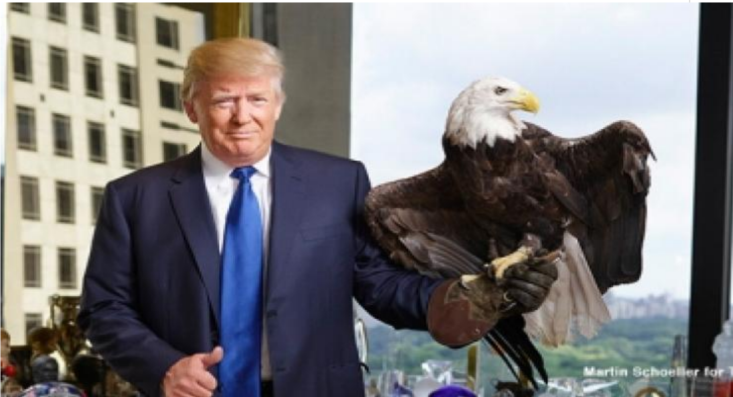
El Imperio más grande del planeta vuelca su fuerza también contra la Naturaleza.

A la luz de tales predicciones parece más sorprendente la postura de los llamados negacionistas del cambio climático, entre quienes destaca el presidente de Estados Unidos.