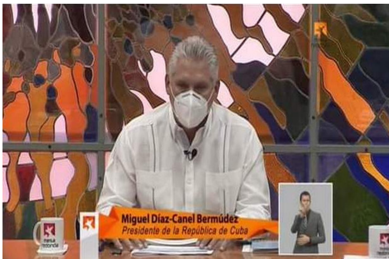
Díaz-Canel abordó aspectos de las campañas mediáticas contra Cuba.