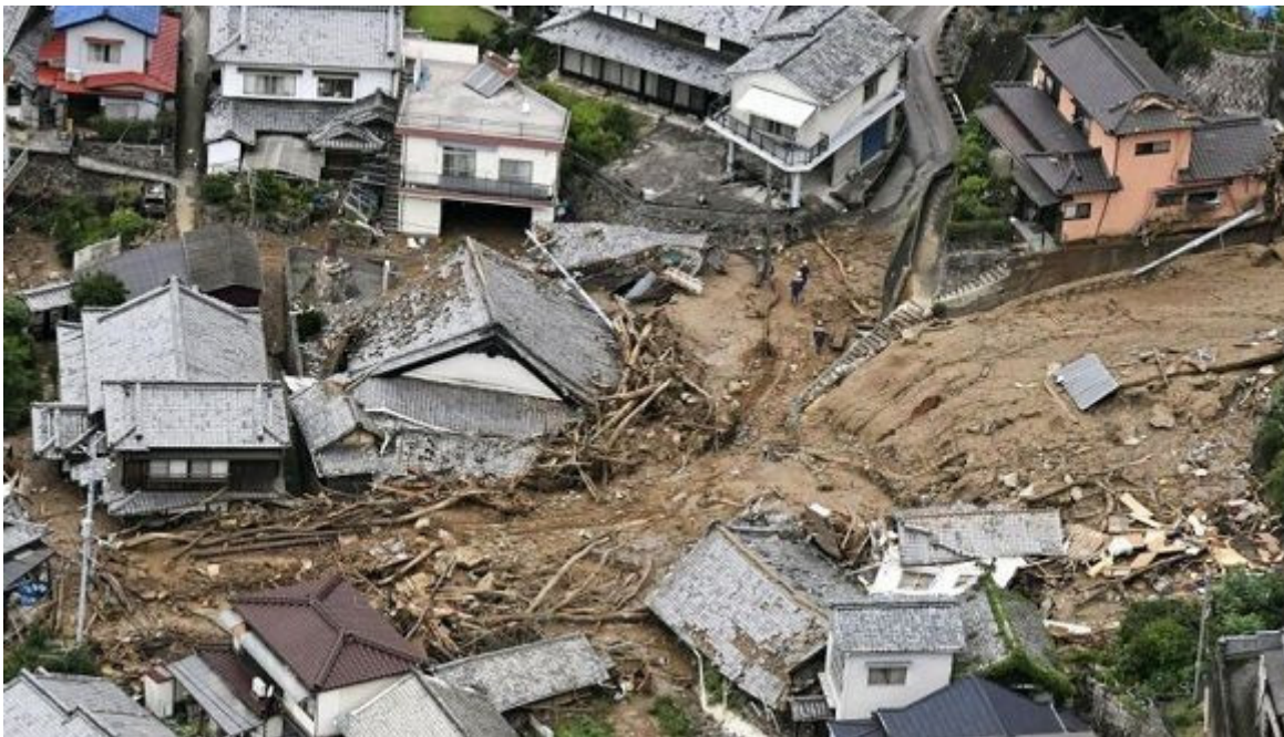
Desastres naturales cada vez más intensos son causados por el cambio climático.

La Habana, 13 oct (RHC) Los primeros 20 años del siglo XXI han sido testigos de un “asombroso” aumento de las amenazas de origen natural y “casi todas las naciones” han fracasado en la prevención de la “ola de muerte y enfermedad” causada por la pandemia Covid-19, advierte la ONU en un informe publicado a propósito del Día Internacional para la Reducción del Riesgo de Desastres, que se celebra este 13 de octubre.