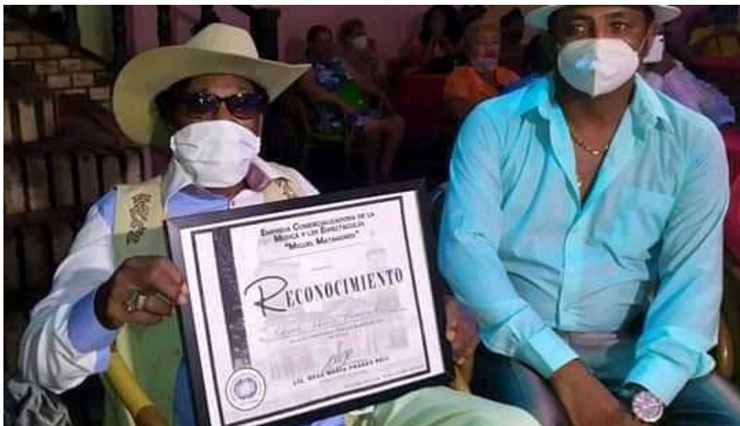
La cultura santiaguera celebra el 17 de octubre el cumpleaños 85 de Eduardo (Tiburón) Morales Orozco.

Santiago de Cuba, 18 oct (RHC) La cultura santiaguera celebra el 17 de octubre el cumpleaños 85 de Eduardo (Tiburón) Morales Orozco, uno de los músicos más queridos y admirados dentro y fuera del territorio nacional, por su manera picaresca de interpretar el son, género oriundo de esta ciudad.