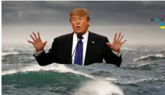
Trump no reconoce la existencia del Cambio Climático

"Él niega que realmente exista el cambio climático antropogénico, o al menos que sea malo. Cree que si se recortan las regulaciones de todo tipo, no solo ambientales, sino también ocupacionales y laborales, creará más puestos de trabajo", opina Gerrard.