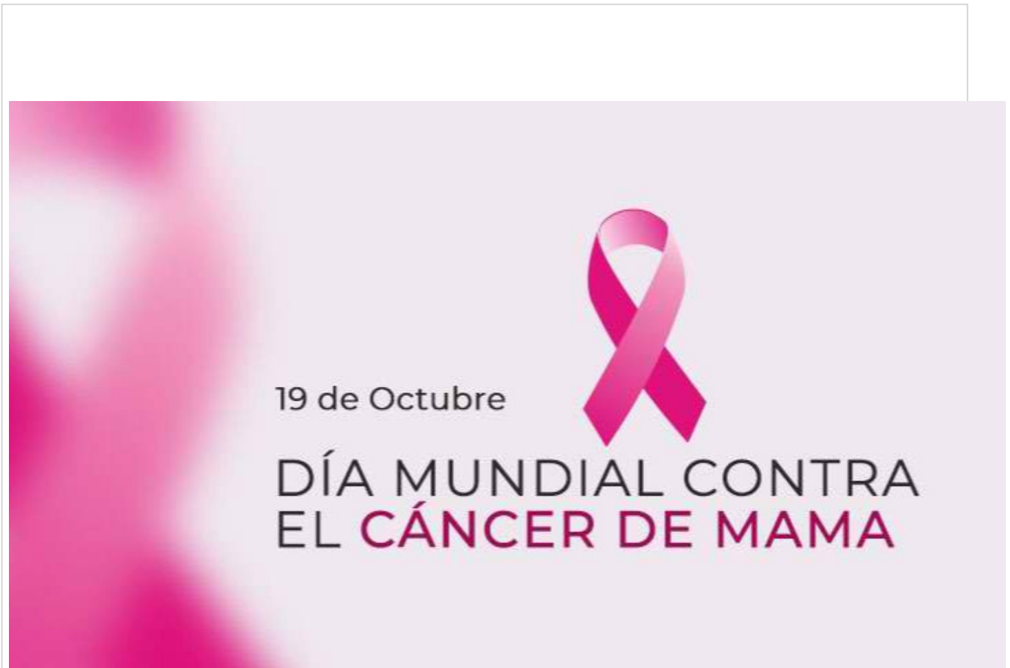
Día Mundial contra el cáncer de mama.

La Habana, 19 oct (RHC) Cada 19 de octubre se celebra el Día Mundial de la Lucha contra el Cáncer de Mama por iniciativa de la Organización Mundial de la Salud (OMS) con el propósito de crear conciencia y promover una detección y diagnóstico precoz de la enfermedad.