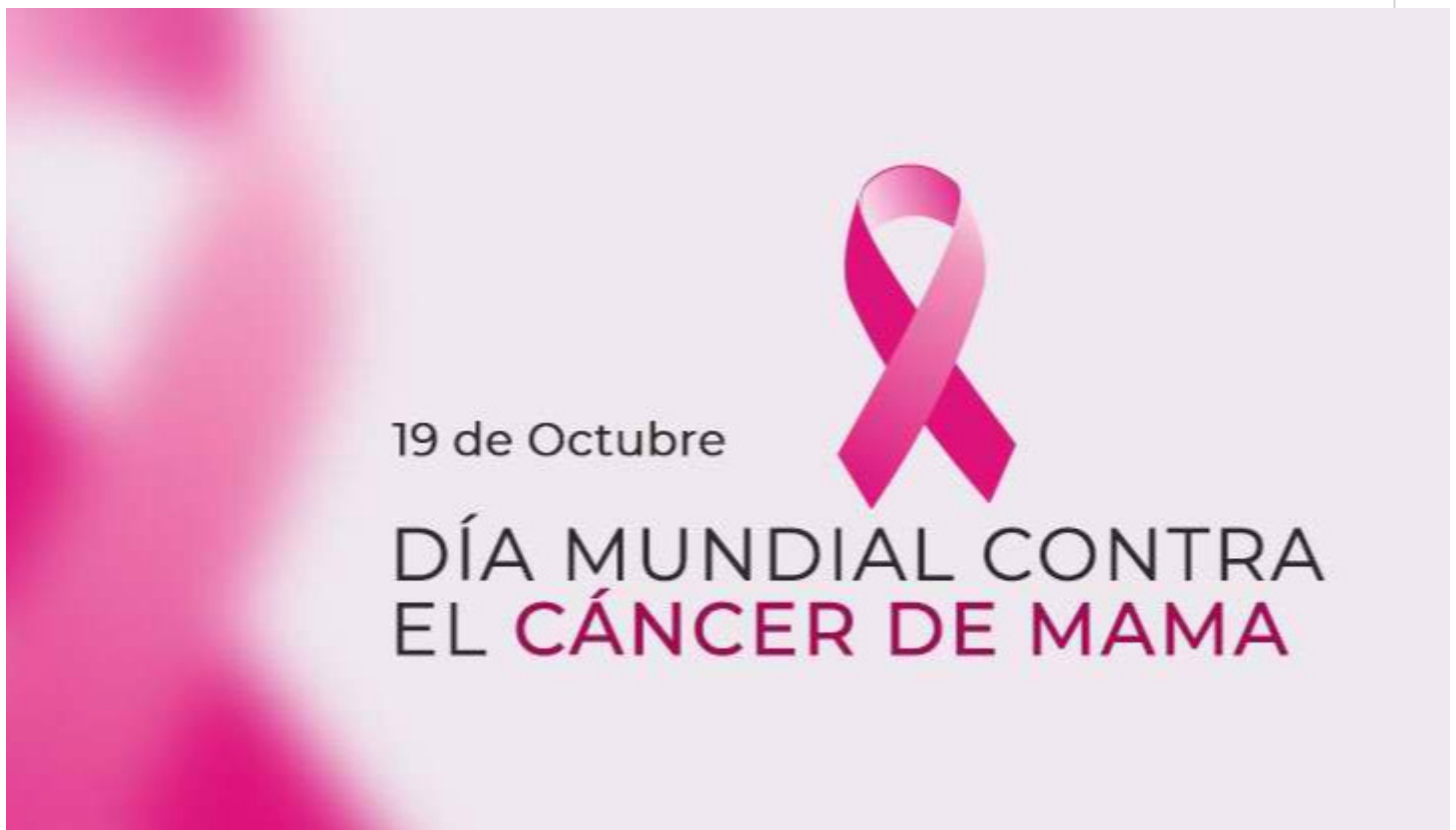
Día Mundial contra el cáncer de mama.

La Habana, 19 oct (RHC) Cada 19 de octubre se celebra el Día Mundial de la Lucha contra el Cáncer de Mama por iniciativa de la Organización Mundial de la Salud (OMS) con el propósito de crear conciencia y promover una detección y diagnóstico precoz de la enfermedad.