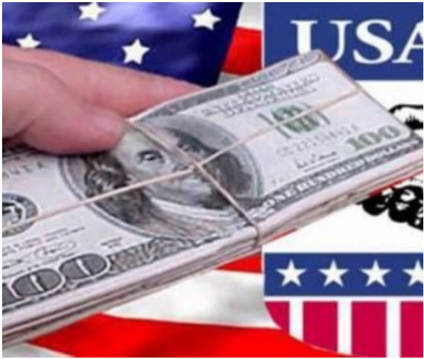
El multimillonario financiamiento a la industria anticubana en tiempos de Trump

La arremetida política de bloqueo y agresión contra Cuba de la administración Trump, sintetizada en las 121 medidas punitivas adoptadas entre 2019 y 2020, ha ido acompañada por numerosas acciones y programas subversivos generosamente financiados por el dinero del contribuyente estadounidense.