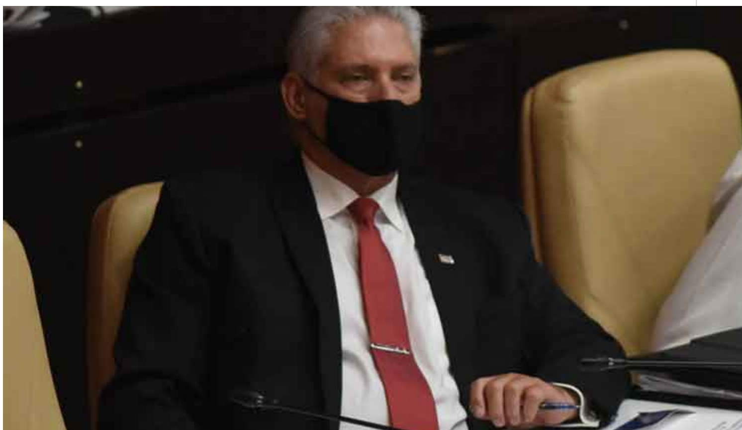
Díaz-Canel a nuevos diputados, es un honor servir a Cuba

La Habana, 26 oct (PL).- El presidente de Cuba, Miguel Díaz-Canel, dijo hoy que es un honor servir a la patria en momentos tan complejos y retadores, durante el acto de juramentación de los nuevos diputados al Parlamento.