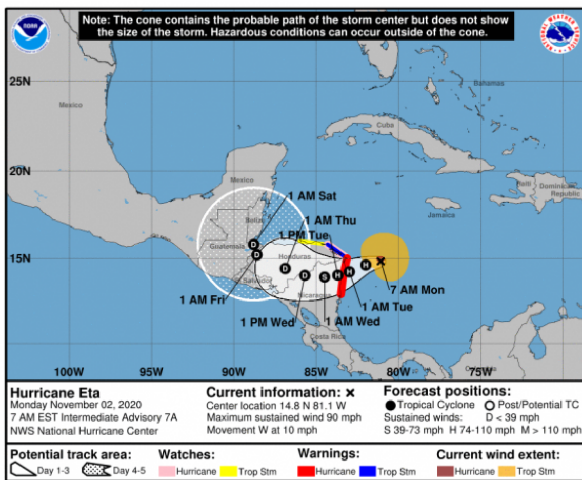
Cono de trayectoria de Eta.

La Habana, 2 nov (RHC) Eta se convirtió en un huracán de categoría uno, con vientos sostenidos de 120 km/h, aunque se espera que se intensifique rápidamente durante las próximas 18 horas a un fuerte ciclón de categoría dos con vientos de 160 km/h.