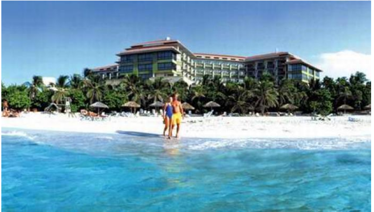
Varadero, principal destino de sol y playa de Cuba. Foto: Archivo/RHC

Bajo el lema “Cuba destino seguro”, la compañía aérea germana reanudó los vuelos hacia el aeropuerto internacional ‘Juan Gualberto Gómez’, de la occidental provincia cubana de Matanzas, el pasado 31 de octubre desde la ciudad de Fráncfort. (Fuente: ACN )