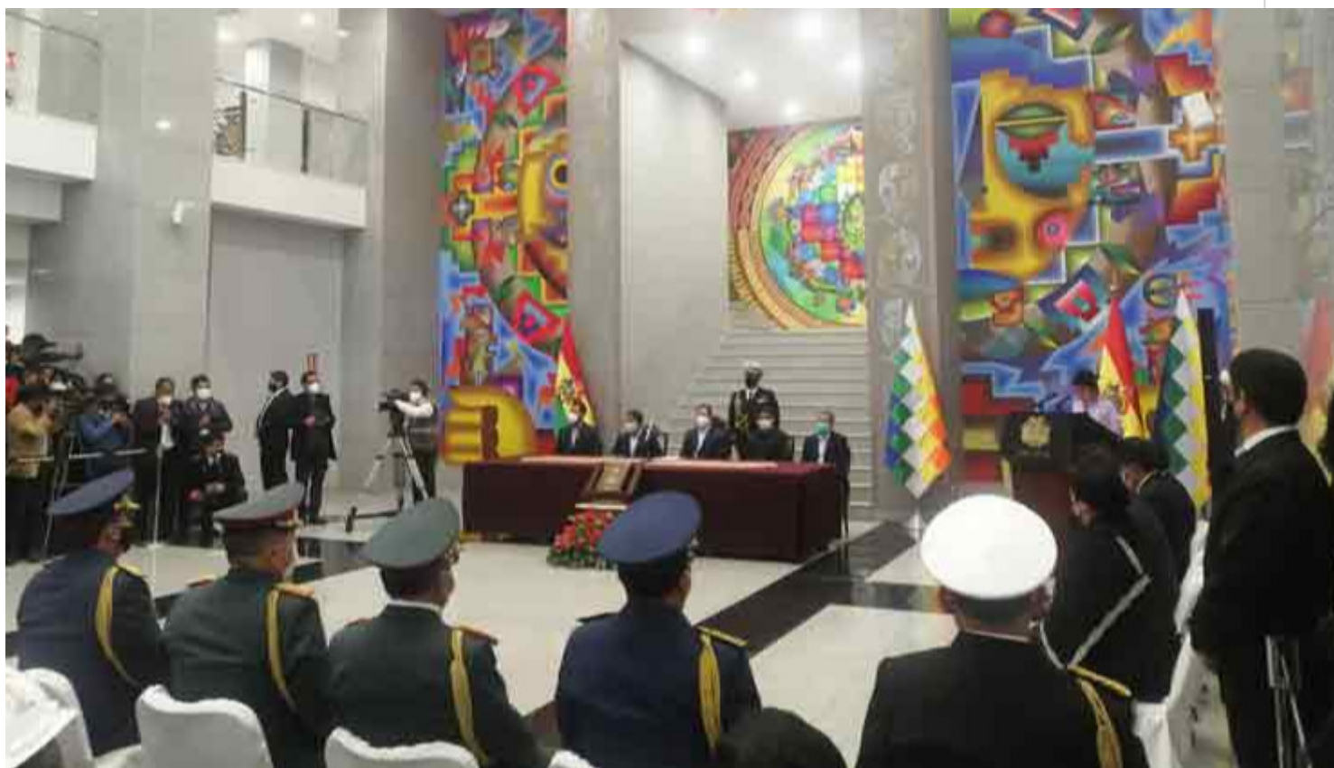
Presidente de Bolivia posesiona a nuevo alto mando militar

La Paz, 16 nov (PL).- El presidente de Bolivia, Luis Arce, posesionó hoy al nuevo alto mando de las Fuerzas Armadas, en acto efectuado en la Casa Grande del Pueblo (sede del ejecutivo).