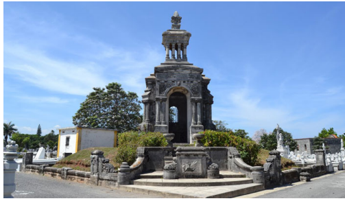
Capilla Franchi Alfaro