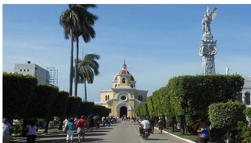
Capilla Central del cementerio

Otros panteones y tumbas y obras escultóricas de atractiva belleza y de interés arquitectónico en la Necrópolis de Colón son: