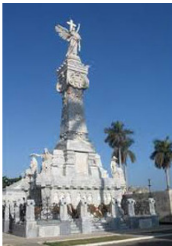
monumento a los bomberos

Entre los Panteones y tumbas famosas y populares del Cementerio Colón se encuentran: