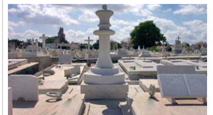
Tumba de Capablanca

Su tumba resalta por el gran rey esculpido en mármol blanco que la hace sobresalir entre todas las vecinas y hace que se divise desde una distancia notable.