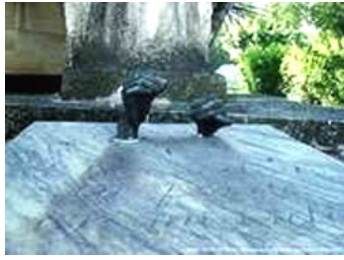
La tumba de la Bordadora

La Tumba de la Bordadora. Encima de la lápida sobresalen dos manos que simulan a una mujer bordando.