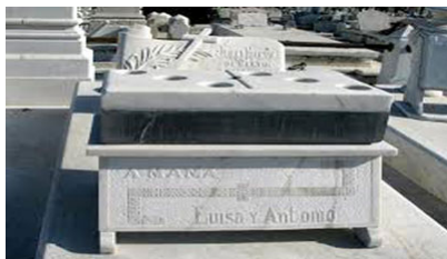
Tumba del Dominó

Sus familiares en su honor mandaron a construir su bóveda en mármol blanco, a semejanza de la ficha fatal.