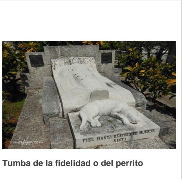
Tumba de la fidelidad o del perrito