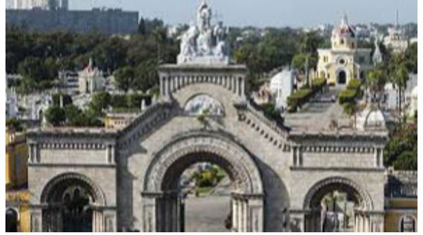
vista del cementerio de Colón

La principal y más majestuosa es la norte, en la esquina de Zapata con la calle 12. Esta puerta denominada arquitectónicamente como Puerta de Triunfo, posee un bello pórtico de estilo neo bizantino obra de Calixto de Loira y un Monumento escultórico en mármol de Carrara, encima del arco de entrada de José Vilalta.