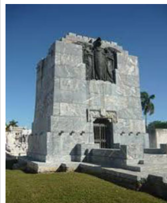
Capilla del Conde de Rivero

La Capilla del Conde de Rivero. Diseñada por el arquitecto Felix Cobarrocas, posee un notable conjunto escultórico que corona la fachada, presidido por un caballero cruzado con todo su arnés y capa, escoltado por las Cuatro virtudes Cardinales.