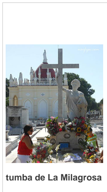
tumba de La Milagrosa