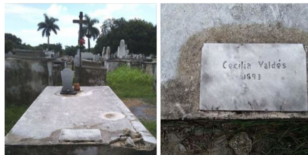
Tumba de Cecilia Valdés.

Los restos de la verdadera Cecilia Valdés hija de la Real Casa de Maternidad fallecida 1893 a la edad de 86 años, descansan en el Campo Común.