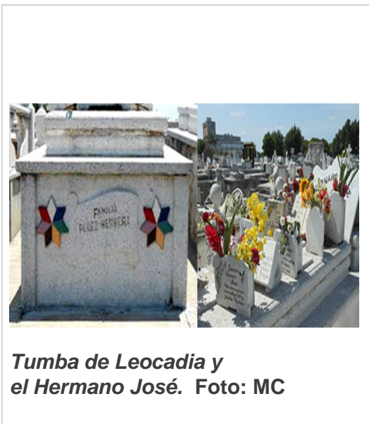
Tumba de Leocadia y el Hermano José.

La Tumba de Leocadia y el Hermano José. Una de las tumbas más populares y visitadas del Cementerio Colón es la de Leocadia y el Hermano José, exponentes de la religión yoruba.