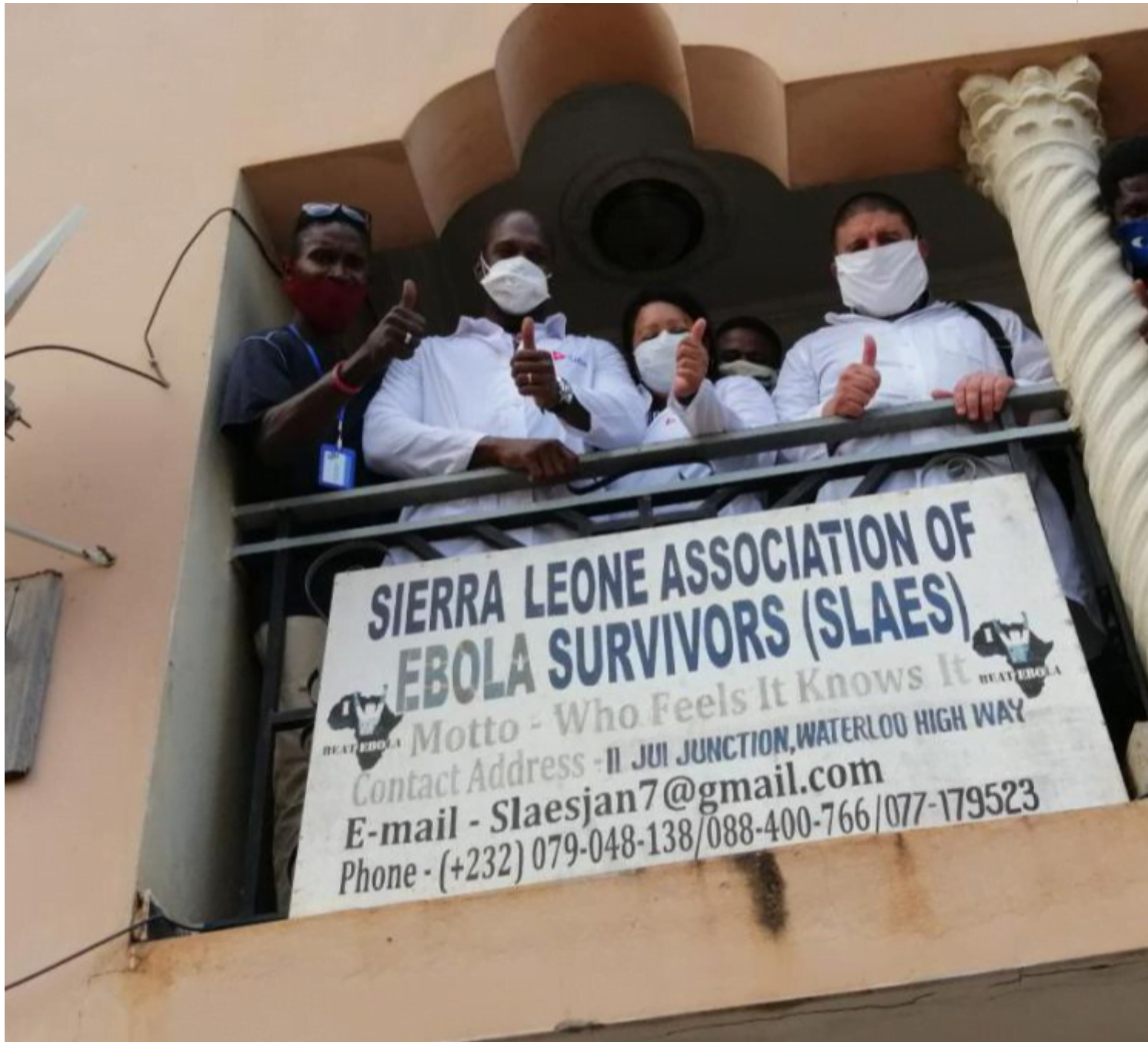
Sobrevivientes del ébola prueba de la solidaridad del ejército cubano de batas blancas.

Freetown, 20 nov (RHC) Una representación de la Brigada Médica Henry Reeve, que combate la COVID-19 en Sierra Leona, se reunió con miembros de la Directiva de la Asociación de Sobrevivientes del Ébola del país africano.