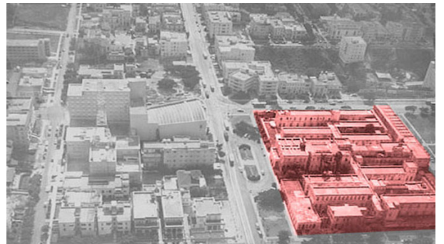
Hospital Reina Mercedes

Alfonso de Borbón, que asumió el trono de España como Alfonso XII, es el tatarabuelo del actual rey Felipe VI. Su madre, Isabel II, la de los tristes destinos y los alegres amores, era hija de Fernando VII. Lo