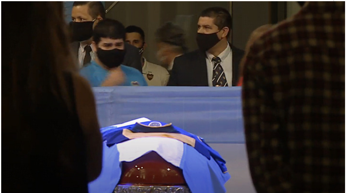
Féretro donde reposan los restos del Pibe de Oro

La acción espontánea se repite desde pasada las seis de la mañana por muchas de los miles de personas que hacen larga fila en la Plaza de Mayo para darle el último adiós al gran D10S, al Diego de la gente, a un hombre que cambió la historia del fútbol latinoamericano.