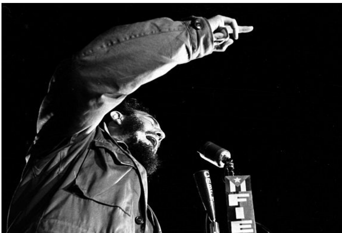
Fidel Castro en la Universidad de La Habana en homenaje a los estudiantes de medicina asesinados por el colonialismo español en 1871, el 27 de noviembre de 1960.

Por: Equipo Editorial Fidel Soldado de las Ideas