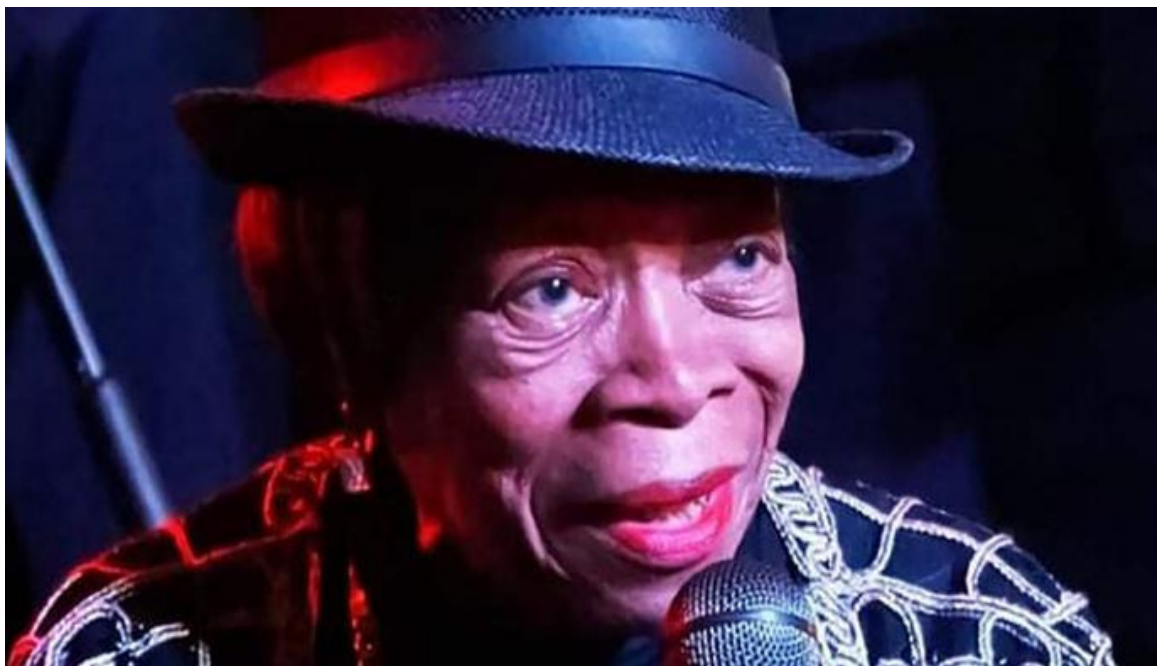
Juana Bacallao.

La Habana, 4 dic (RHC) El Premio Nacional del Humor 2020 fue conferido a la reconocida artista Juana Bacallao y al caricaturista, ilustrador y pintor Arístides Hernández (Ares), por decisión unánime del jurado.