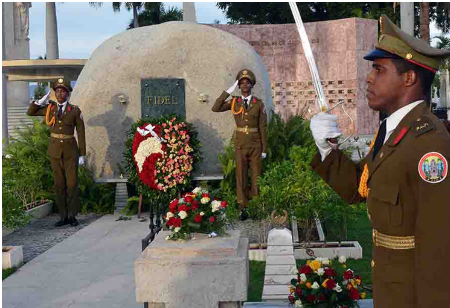
La roca donde reposan las cenizas del líder es custodiada por la joven generación.

La Habana, 4 dic (RHC) El pueblo santiaguero en representación de toda Cuba colocó una ofrenda floral, este 4 de diciembre, ante el monolito donde desde hace cuatro años reposan las cenizas del líder histórico de la Revolución, Fidel Castro Ruz, en el cementerio Santa Ifigenia.