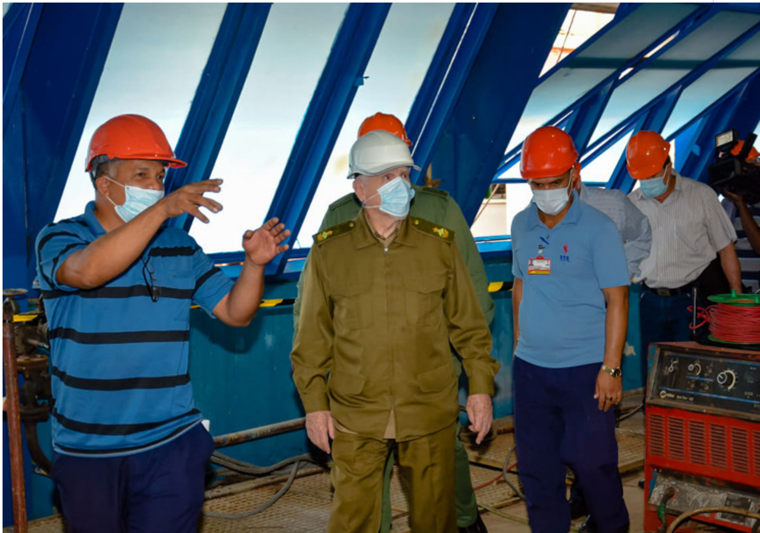
Valdés Menéndez conoció de las acciones en el área de la caldera.

La Habana, 4 dic (RHC) El Comandante de la Revolución Ramiro Valdés Menéndez, vice primer ministro de la República de Cuba, constató este viernes el desarrollo del plan de inversiones, enfocado en la rehabilitación del bloque generador número uno de la Empresa Termoeléctrica 'Lidio Ramón Pérez', en el