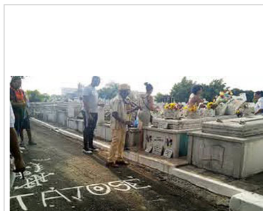
violín a Ta José

Fanáticos y devotos le ofrecen cada 19 de marzo, día de San José, un toque de violín y otros rituales, así como son escuchadas melodías como el Ave María y la Bella Cubana.