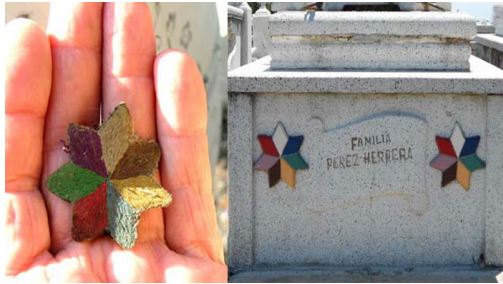
Estrella en la tumba de Leocadia y Ta José.

Una estrella tejida de siete puntas y siete colores que constituye el símbolo que representa al Hermano José, está presente en la bóveda que los guarda. También es confeccionada de tela para ser llevada o guardada por los creyentes.