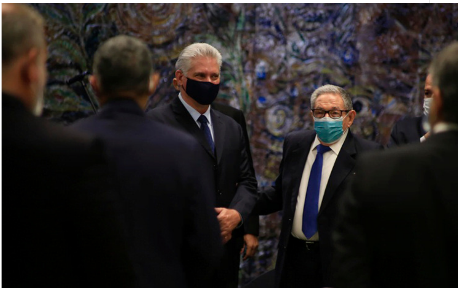
Díaz-Canel (I) y Raúl (D) en el acto celebrado en el Palacio de la Revolución.

La Habana, 10 dic (RHC) El General de Ejército Raúl Castro Ruz, primer secretario del Comité Central del Partido Comunista de Cuba (CCPCC), y Miguel Díaz-Canel Bermúdez, presidente de la República, presidieron el 9 de diciembre el acto político-cultural por las seis décadas de relaciones diplomáticas entre Cuba y Vietnam (2 de diciembre).