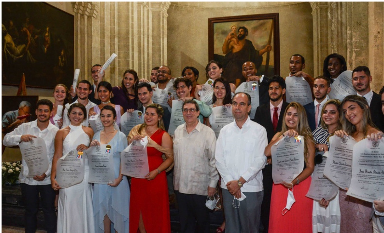
La graduación del ISRI estuvo dedicada a Eusebio Leal.

La Habana, 10 dic (RHC) A Eusebio Leal, Historiador de La Habana, estuvo dedicada este jueves la graduación del Instituto de Relaciones Internacionales Raúl Roa -ISRI-, correspondiente al curso escolar 2019-2020.